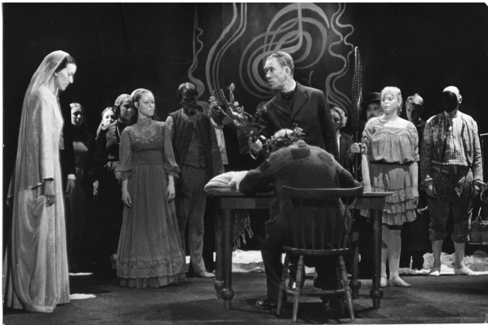
Ett drömspel från 1970.

Jag vill också säga att det var med Ett drömspel som gästspelandet utomlands tog fart. Vilka resor och vilken entusiastisk publik! som lyssnade till texten i hörlurar, där en man och en kvinna läste den löpande texten på landets språk. Vi var i Amsterdam, Wien, Helsingfors, London, Belgrad, städer i Tyskland, Venedig där dekorationerna fraktades i gondoler på kanalerna från tågstationen till teatern. Märklig syn!